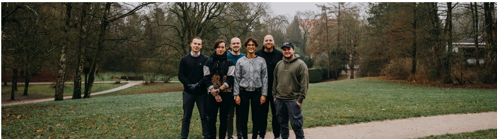
Ein Teil unseres Teams: Zusammen, Gemeinsam, Stark! - SoulTrip e.V. und SCT Shed GmbH & Co.KG